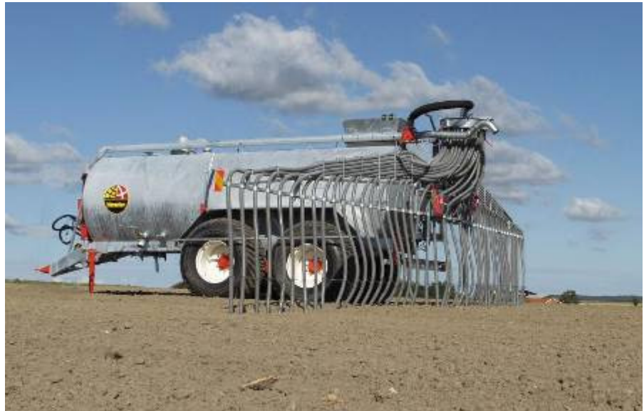
Bogie og Tridem